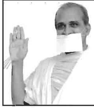
પૂ. આચાર્ય પ્રકાશમુનિ